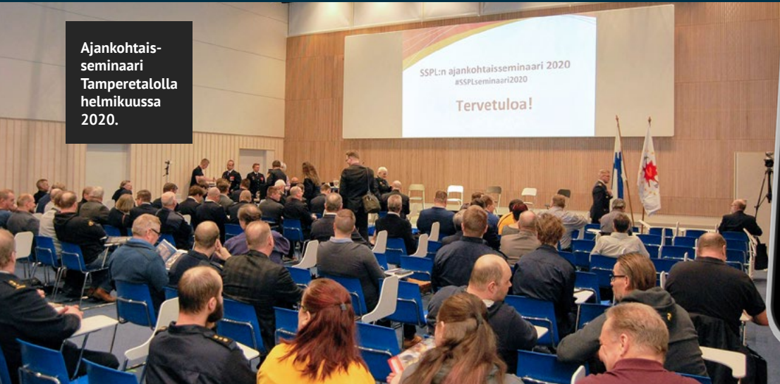
Ajankohtaisseminaari Tamperetalolla helmikuussa 2020.