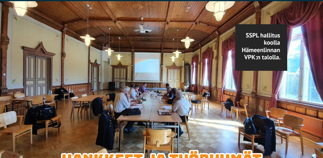
SSPL hallitus koolla Hämeenlinnan VPK:n talolla.